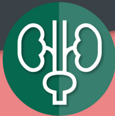
Grupo de Trabajo Nefrourología