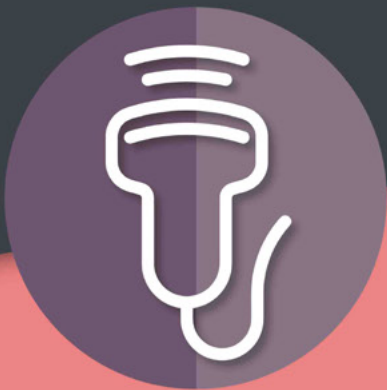
Grupo de Trabajo Ecografía