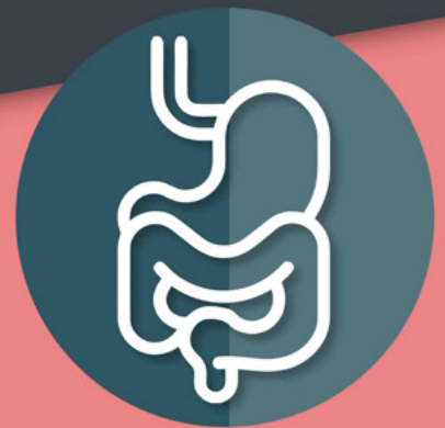
Grupo de Trabajo Digestivo

Creando lazos, superando barreras, aprendiendo juntos